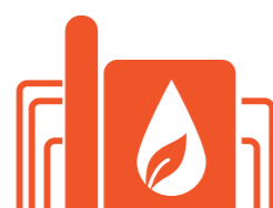
A gecertificeerd (Biodiesel Kampen)

1. Bedrijf A koopt - op papier - via opslagbedrijf B niet-duurzame biodiesel van bedrijf C.