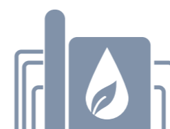
A gecertificeerd (Biodiesel Kampen)

2. Bedrijf C koopt bewust niet-duurzame biodiesel met valse certificaat van duurzaamheid terug van bedrijf A.