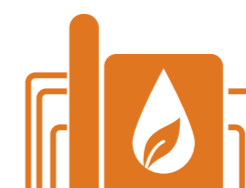
C niet gecertificeerd

3. Via bedrijf A of C komt vervalste biodiesel bij het tankstation en dus de automobilist terecht.