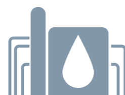
C niet gecertificeerd

2. Bedrijf C koopt bewust niet-duurzame biodiesel met valse certificaat van duurzaamheid terug van bedrijf A.