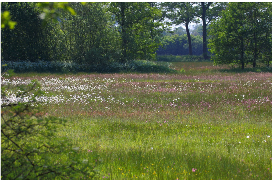
Kruidenrijk grasland met houtsingels

Het beheerplan dat uit zo'n onderzoek komt zal bepalend zijn voor de exploitatie. Dat kan variëren van “ voorlopig braak laten liggen ” tot “ exploitatie onder voorwaarden ” mogelijk.