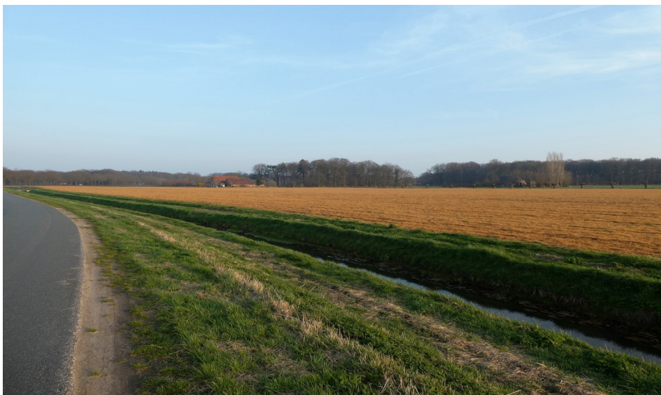
Glyfosaat doodt het bodemleven